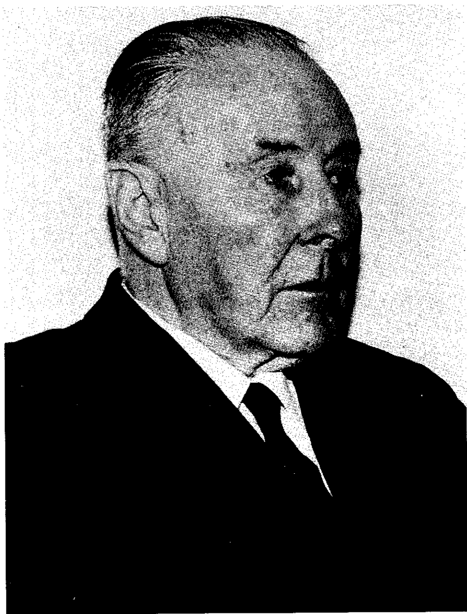
12. Ds. E. du Marchie van Voorthuysen was in de jaren zestig en zeventig één van de bekendste predikanten van de Oud-Gereformeerde Gemeenten in Nederland.